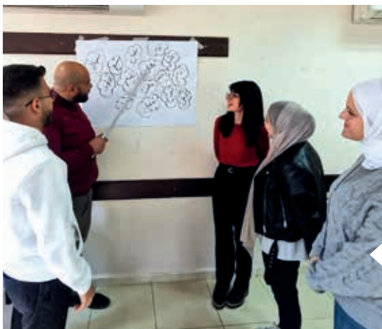
Gennem netværket YED-hub uddannes ungdomsledere i at undervise om medborgerskab.

– Ja, vi ville starte et fællesskab for unge, der vil gøre en forskel for klima og miljø. Samtidig er vi i fuld gang med at lave aktiviteter for børn og unge