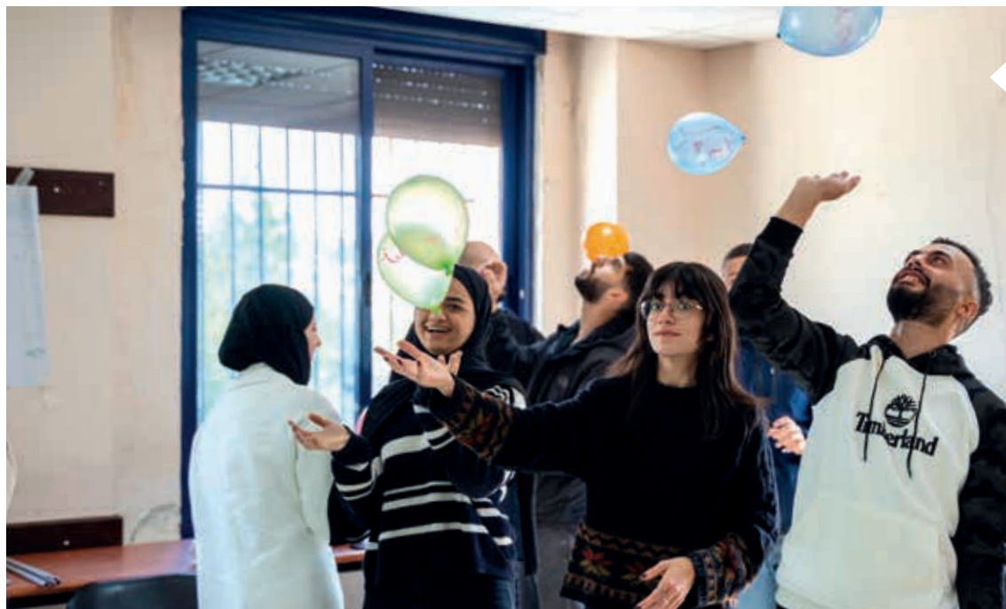
Leg, sport og konkurrencer adspredte de unges tanker.

– Ja, det handler om at uddanne de unge til at være gode medborgere. Det gør vi i samarbejde med seks lokalråd og seks ungdomsklubber.