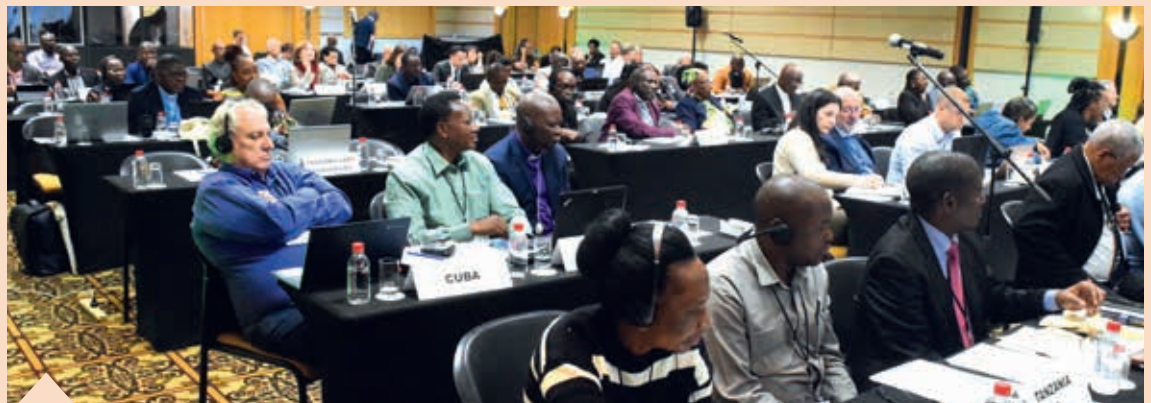
Brødrekirkens verdenssynode vedtager en resolution, der anerkender og undskylder Brødrekirkens historiske meddelagtighed i kolonialisme, slaveri og racisme.