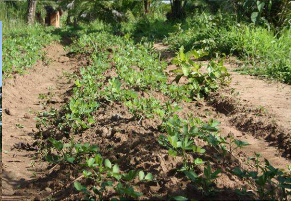
Her prøves til med jordnøddedyrkning. Nu må vi se, om de klarer sig bedre end solsikkerne !!