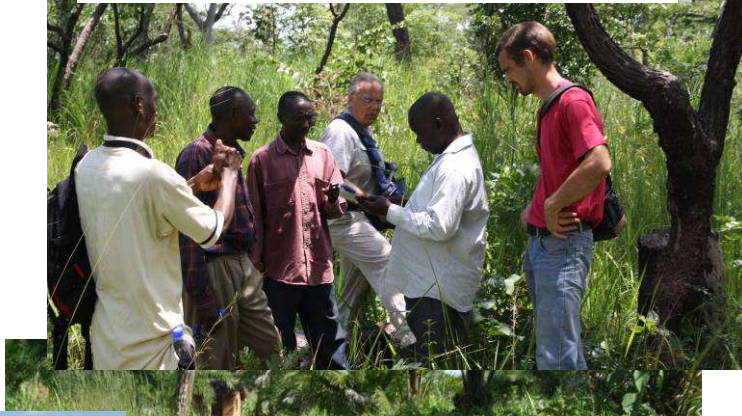
Fra vores tur, for at se på jord. Er vi mon faret vild ??